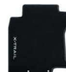
Dywaniki welurowe - zestaw na tył i przód