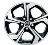
Felga aluminiowa 17"